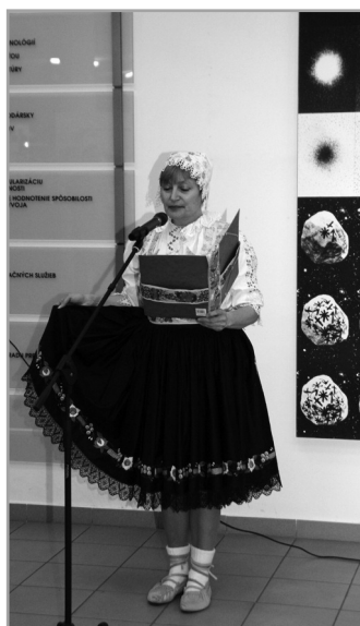
Recepčia konferencie GL 15

Súčasťou konferencie a príjemnou spoločenskou udalosťou bolo zorganizovanie recepcie v priestoroch CVTI SR. Recepčia bola milým spretrením programu, nakoľko poskytla účastníkom nielen priestor pre neformálnu komunikáciu, ale aj možnosť spoznať našu krajinu, zvyky, kuchyňu a ľudové umenie.