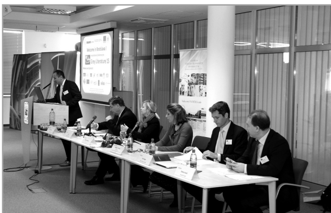
Úvodná sekcia konferencie GL 15

V dňoch 2. – 3. decembra 2013 sa v priestoroch CVTI SR konal 15. ročník medzinárodnej konferencie o sivej literatúre – GreyLiterature 15. Národnostné zloženie konferencie býva každý rok veľmi pestré, do Bratislavy pricestovali účastníci z Českej republiky, Poľska, Ruska, Rakúska, Kamerunu, Japonska, Kórey, Kanady, USA, Veľkej Británie, Holandska, Švajčiarska, Francúzska, Talianska, Grécka, Austrálie, Nórska a Nového Zélandu. Slovensko reprezentovali pracovníci CVTI SR s tromi príspevkami a štyrmi posterami, ako aj členovia Katedry knižničnej a informačnej vedy FiF UK v Bratislave s dvoma prednáškami.