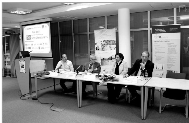
Záverečná sekcia konferencie GL 15

Záverečná sekcia konferencie poskytla priestor na zhodnotenie 15. ročníka konferencie v Bratislave, ako aj odovzdanie pomyselného žezla do rúk organizátora 16. ročníka GreyLiterature, ktorým je Library of Congress vo Washingtone, USA. Konferencia sa bude konať v dňoch 8. – 9. decembra 2014.